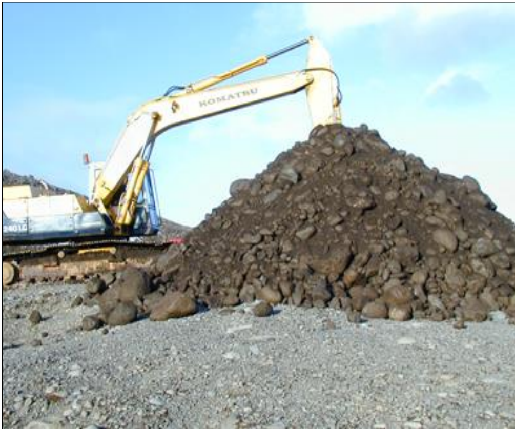
Mynd 2: Grafið í grófa hnallungamöl