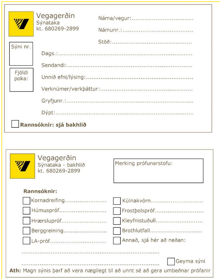
Mynd 11: Sýnatökumiði Vegagerðarinnar

Að lokum má birta hér mynd af nýlegum sýnatökumiða Vegagerðarinnar, þ.e.a.s. bæði af framhlíð og bakhlið miðans, sjá mynd 11.