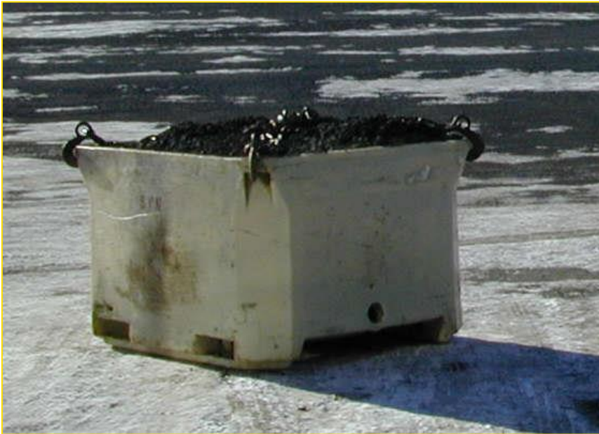
Mynd 7: Stór sýni eru oft tekin í fiskiker

Ef aðstæður leyfa er það talinn kostur að fletja efnishaug út áður en sýnataka fer fram. Það hefur þó ekki tíðkast hérlendis við sýnatöku, heldur gert eins og lýst er hér að ofan.