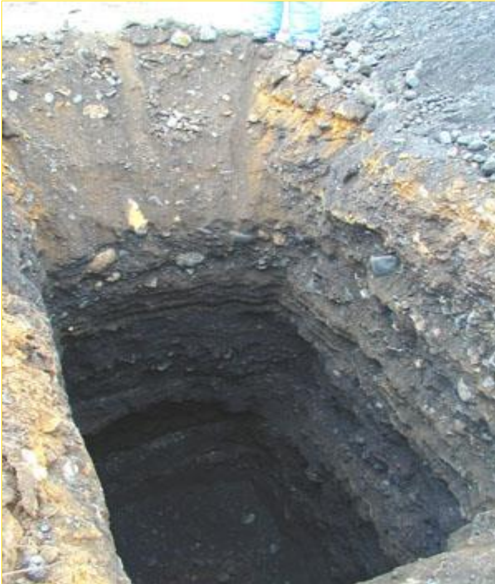
Mynd 4: Sandlög í lagskiptri, sandríkri möl

Sýnataka úr námustáli getur verið vandasöm sérstaklega þar sem hættu er á blöndun úr jarðvegslagi og aðliggjandi setlögum, enda getur verið nauðsynlegt að losa talsvert magn til að hægt sé að ná marktæku sýni.