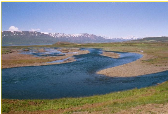
Mynd 1: Námusvæði við Fnjóská

Æskilegt er að staðsetja fyrir fram á loftmynd eða korti gryfjustaði þar sem taka á sýni. Þetta tryggir jafna dreifingu gryfja auk þess sem minni líkur eru á að val á gryfjustöðum verði hlutdrægt, t.d. að eingöngu sé grafið á flötum, þurrum og ógrónum stöðum en efnisgerð getur verið misjöfn eftir slíkum aðstæðum. Hnit gryfjustaðanna er skráð í GPS tæki og staðirnir fundnir með hjálp tækisins.